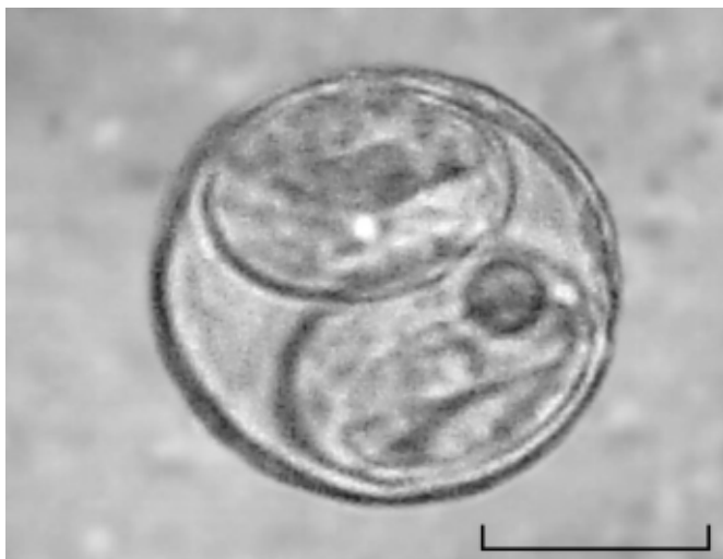
Figura 2. Oocisto esporulado de Cystoisospora ohioensis obtido das fezes de camundongo Mus musculus após a segunda passagem. Técnica de centrífugo-flutuação em solução saturada de açúcar. Escala=10 \mu\text{m} .

Letras diferentes significância em nível de p < 0,05 pelo teste t de Tukey.