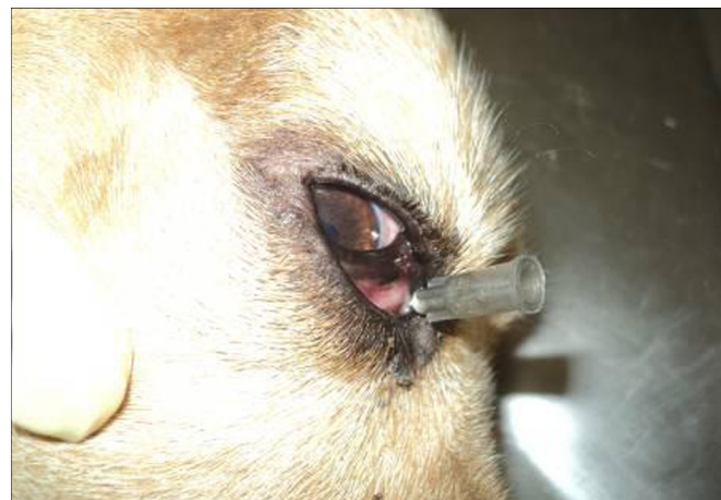
Figura 2. Animal com o duto nasolacrimal direito superior canulado, sob anestesia geral.