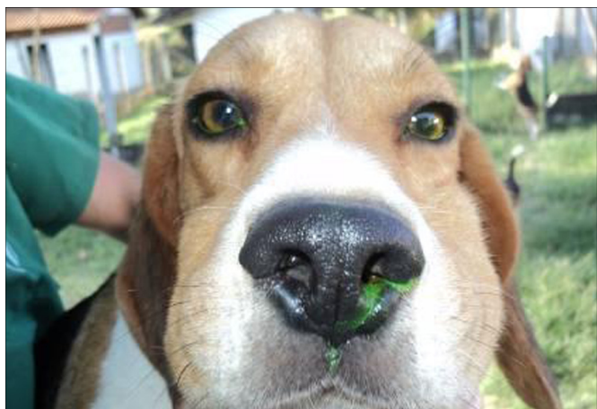
Figura 3. Animal apresentando teste de Jones negativo no olho direito em que houve obstrução do duto nasolacrimal, no dia 28 (pós-obstrução).

Todos os olhos tratados foram negativos no teste de Jones ao final de 28 dias (Figura 3). Para confirmação da obstrução utiliza-se o colírio de fluoresceína que ao ser instilado nos olhos, penetra pelos pontos lacrimais, principalmente o inferior e flui pelo ducto nasolacrimal. Se a drenagem estiver patente, observa-se o corante no assoalho da narina ipsilateral. O tempo estimado do percurso é de três a cinco minutos. Se ocorrer atraso na drenagem do corante (tempo maior que cinco minutos) ou o não aparecimento do mesmo no assoalho correspondente, o diagnóstico é negativo e confirma a obstrução (Jones & Wobig 1976, Kleiner 2003, Grahn & Sandmeyer 2007).